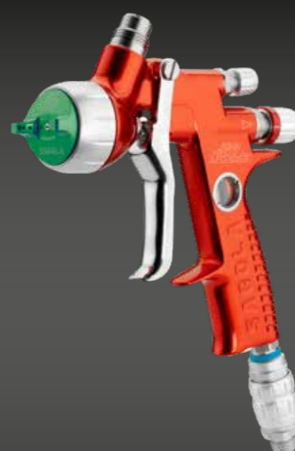
4600 Xtreme HVLP