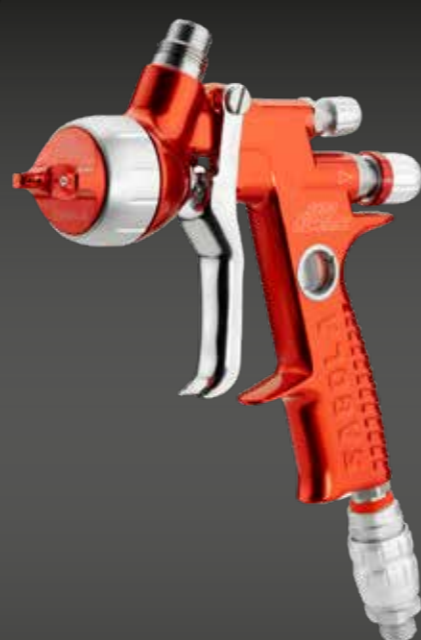
4600 Xtreme HS