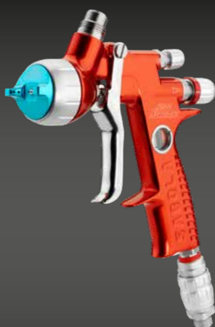
4600 Xtreme EAU