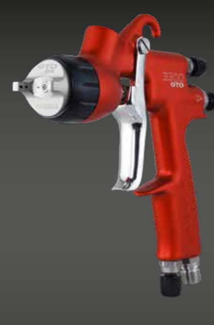
3300 GTO PRIMER