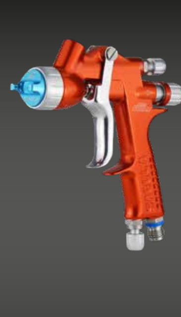
mini Xtreme RÉPARATION RAPIDE