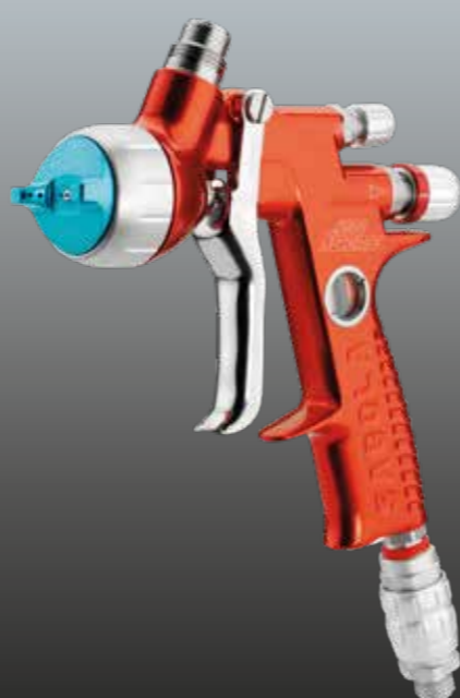
4600 XUREME EAU