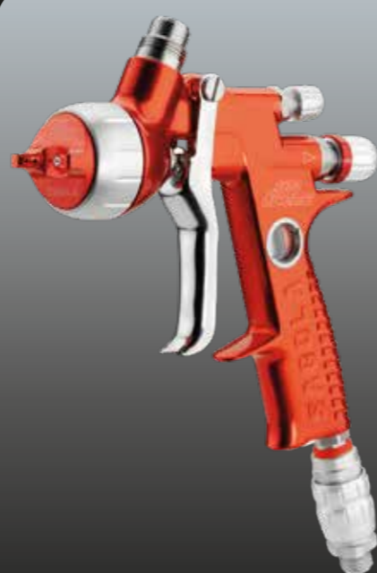
4600 XUREME HS