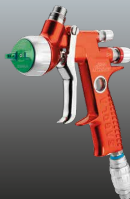
4600 XUREME HVLP