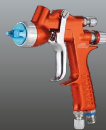
mini XUREME RÉPARATION RAPIDE