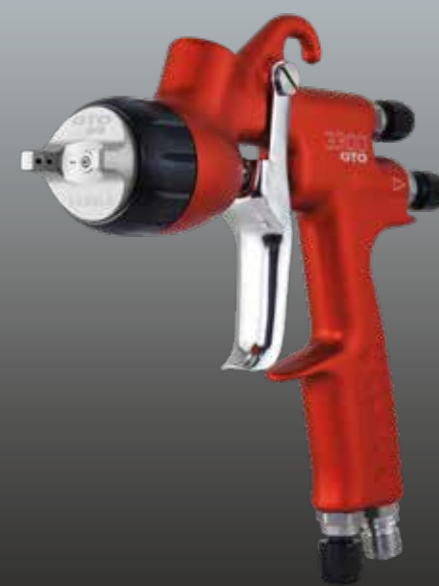
3300 GTO APPRÊT